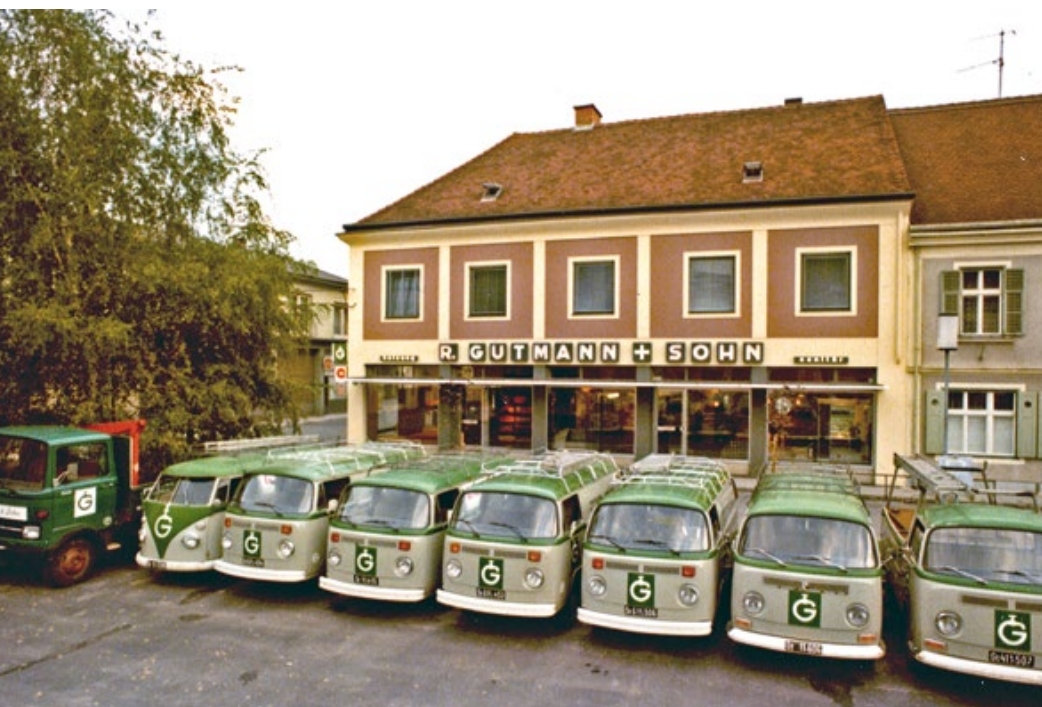
Die Gutmann-Fahrzeugflotte Anfang der 80er Jahre.