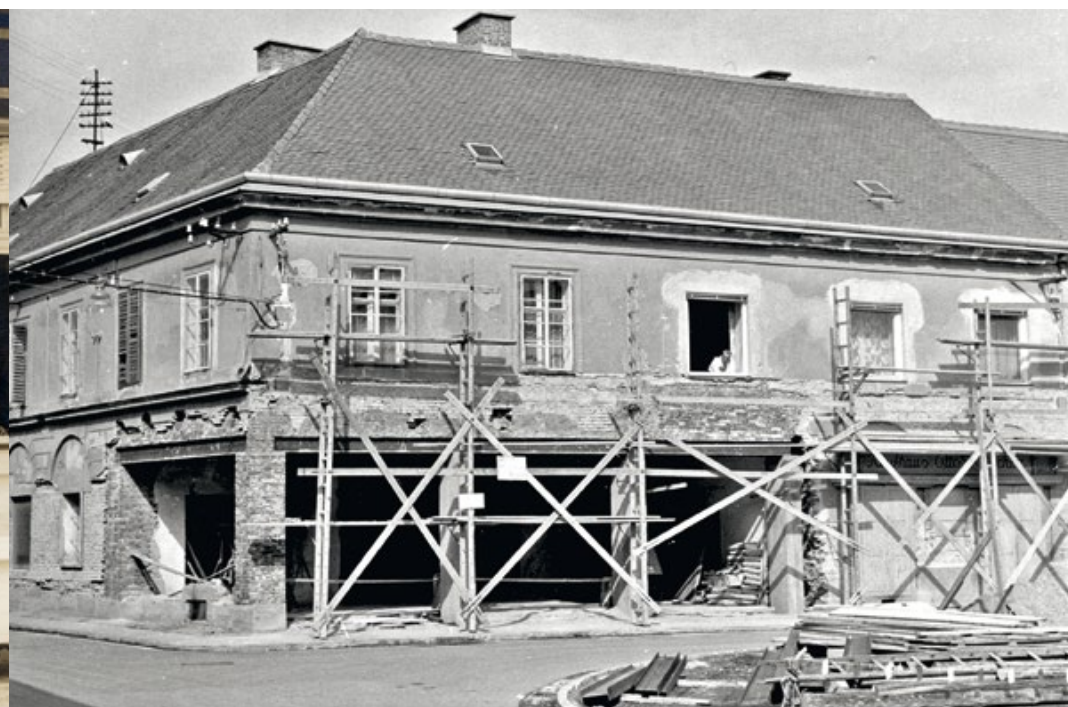
1966: Umbau des künftigen Stammhauses am Grazerplatz 6.