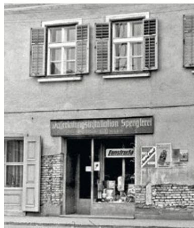
1935: Spenglereibetrieb im „Depisch-Haus“ am Grazer Platz 5.

Übersiedlung in das Haus Grazerplatz 5 – dem „Depisch-Haus“.