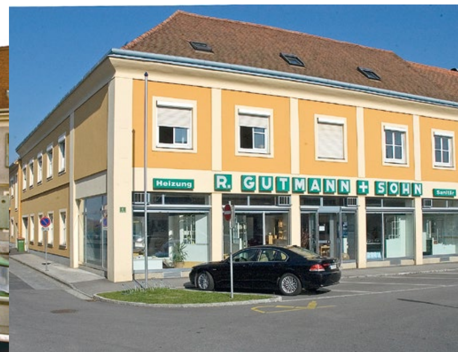
Stammhaus am Grazerplatz 2007.

1930 1940 1950 1960 1970 1980 1990 2000 2010 2020