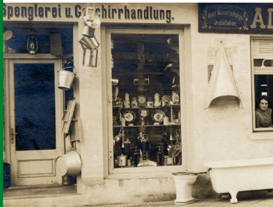
1932: Erstes Domizil der Spenglerei in der Santnergasse.