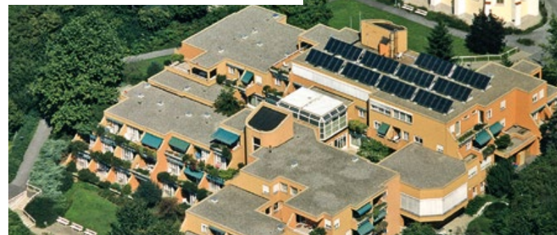
1976: Gutmann & Sohn montiert die ersten Solaranlagen. Der „Augustinerhof“ (Foto) wird 1994 mit Solarmodulen bestückt.

Gründungsmitglied der LSI „Leistungsgemeinschaft Steirischer Installateure“.